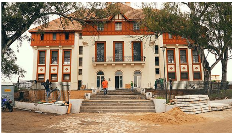
Tribuna del Hipódromo Sede Barrio Jardín

Luego de la firma del contrato para su construcción con la empresa Roggio e hijos S.R.L la nueva sede se inaugura en 1.946 constituyéndose desde entonces en un emblemático edificio de la ciudad, indiscutido hito de la misma. De estilo Neocolonial, vinculado a modelos históricos fundamentalmente hispánicos, se encuentra clasificado en Categoría Media (Protección del Patrimonio Arquitectónico, Urbanístico y de Áreas de Valor Cultural de la Ciudad de Córdoba) según Ordenanza N° 11.202 y modificatorias.