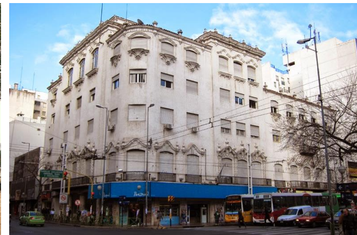
Av. Colón y General Paz Sede Centro

En la inauguración del edificio de sede Centro, se realizó una muy importante muestra artística con más de 200 obras pictóricas y escultóricas de destacados artistas cordobeses y nacionales. Desde entonces, el Jockey Club Córdoba desde la Subcomisión de Cultura creada en 1.946, realiza una intensa actividad cultural llevando a cabo diversas manifestaciones artísticas e intelectuales en la ciudad, organizando para los socios y la sociedad toda diferentes eventos como conferencias, conciertos, exposiciones,